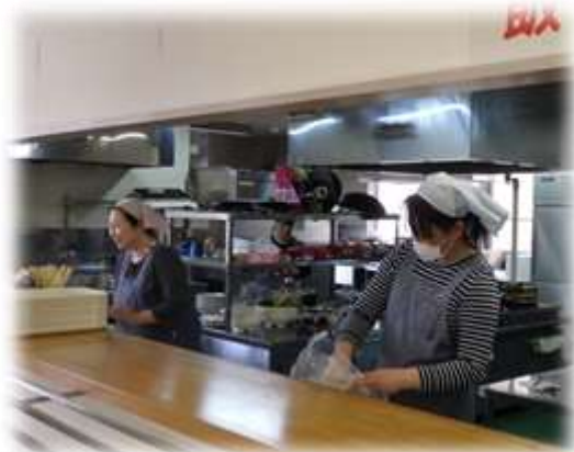
〔食堂スタッフの皆さん〕

売店で販売されている鶏の唐揚げやチャーハン、カツサンド等も食堂内での手作りです。部活動の合宿でも美味しい「おふくろの味」を提供してくれます。