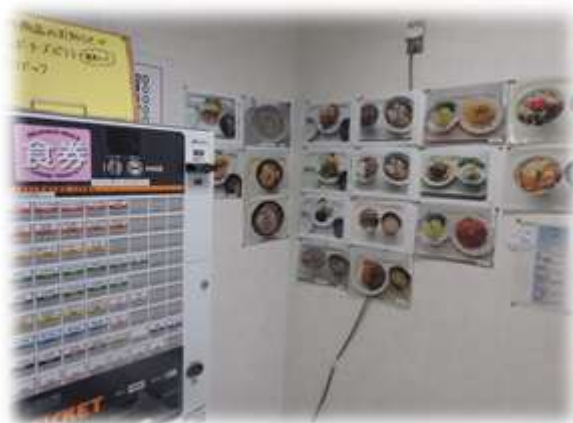
〔食堂入り口の食券販売機とメニュー〕

◆3年生男子：マヨたれ唐揚げ定食（450円）をよくたのみます。美味しくて「1番人気」というのが分かります。